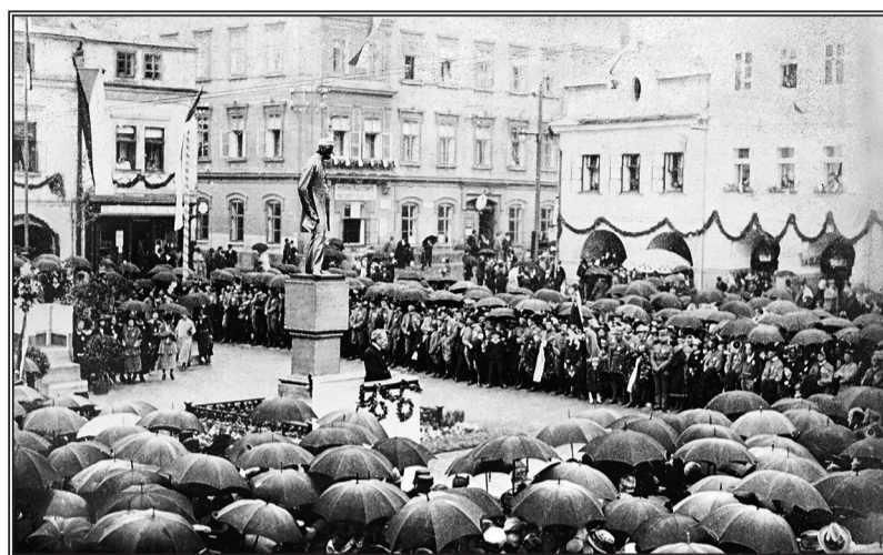
Odhalení pomníku Bedřicha Smetany od ak. sochaře Jana Šturso 22. června 1924

Vraťte se s námi také letos na začátek minulého století a projděte se v šatech po babičce či dědečkovi lázeňskou kolonádou. Jen díky vám přestaly být